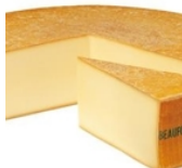
Beaufort d'été 200 grs