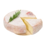
Reblochon 1/4 - 125 grs