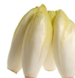
Endive Région Lyonnaise