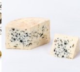
Bleu des Causses 150 grs