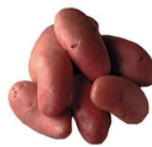
Pomme de terre chair ferme rouge Chérie