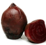
Betterave rouge cuite