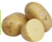
Pomme de terre ronde

Produits issus de l'agriculture biologique, certifié par FR-BIO-01