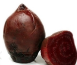
Betterave rouge cuite