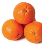
Orange dessert Lanelet