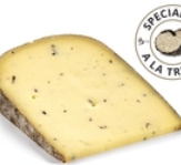
Tomme aux truffes 150 grs