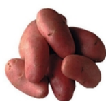
Pomme de terre chair ferme rouge Chérie