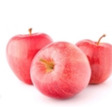
Pomme Royal Gala